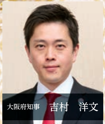
大阪府知事 吉村 洋文