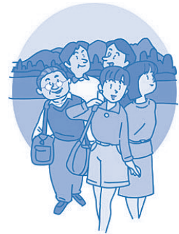
平成28・29年度中央南支部役員名簿